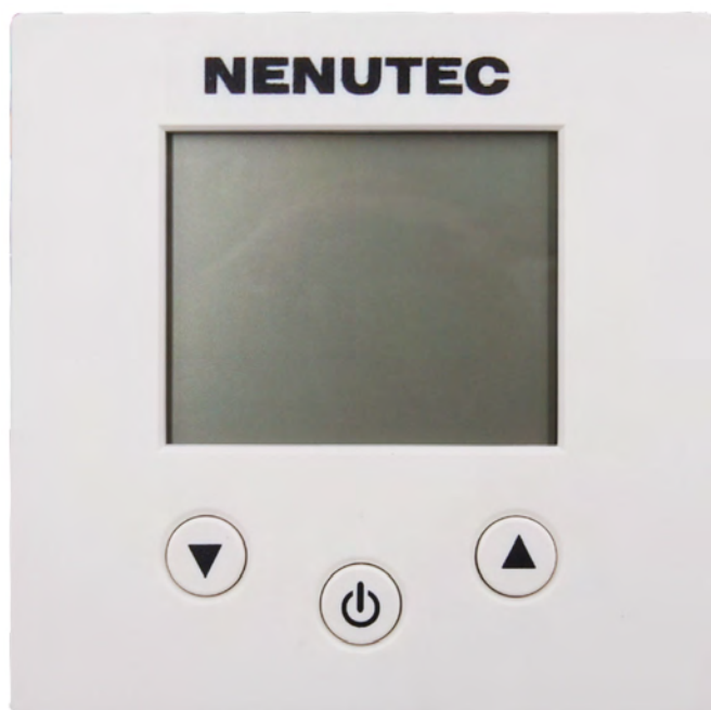
Wygląd urządzenia może odbiegać od przedstawionego na ilustracji. Dane techniczne mogą ulec zmianie.

Zadajnik pomieszczeniowy z wyświetlaczem LCD, do inteligentnych siłowników NSVA